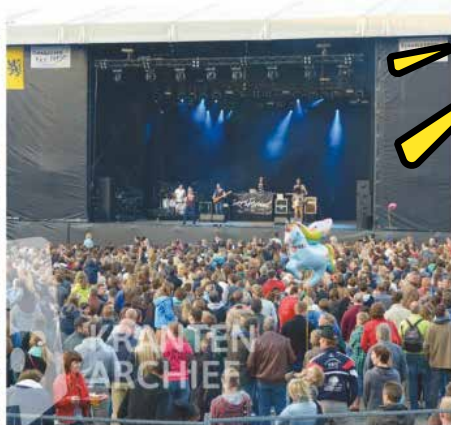
Hee Tervuren lokt elk jaar een massa vol naar het centrum.

Er zijn diverse gratis- en eenzijdig voorziene op het marktplein, maar