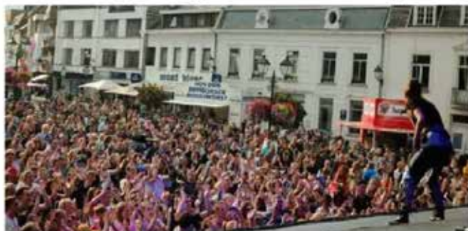
Hee Tervuren tijdens de editie van 2019.

TERVUREN Het festival vond tot 2016 plaats aan het einde van juni of het begin van juli. In 2017 besloot het gemeentebestuur het evenement na 15 jaar stop te zetten en het te laten opgaan in de Reuzenfeesten. Deze vinden traditioneel begin september in het centrum van Tervuren plaats. De keuze kreeg toen heel wat kritiek van de oppositie. “Men wou destijds een muziek-